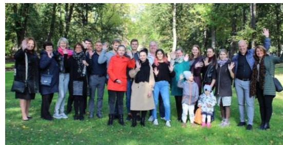
Met studenten in het park

geïnterviewd. Er werd gezamenlijk lekker gegeten en de sfeer was erg goed en er werd openhartig gesproken. Een paar studenten konden al een aardig woordje Engels spreken, wat de communicatie sterk bevorderde. We zijn dat niet gewend want er wordt normaalgesproken geen Engelse les gevolgd. De beste drie studenten kregen een extraatje als dank voor hun inzet en unieke prestatie. We sloten de dag af met een korte wandeling naar een park in de buurt waar we tevens nog wat foto's konden maken.