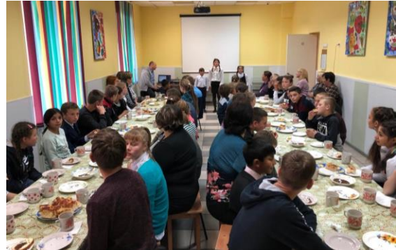
Witbrood met veel roomboter en hagelslag eten