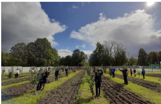
Alle weeskinderen bij een boom in de boomgaard