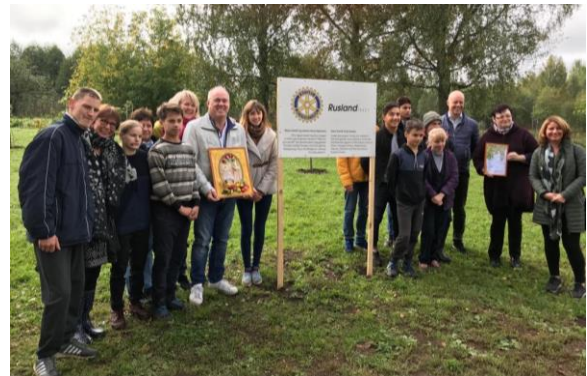
Krasnogorodsk special boarding school