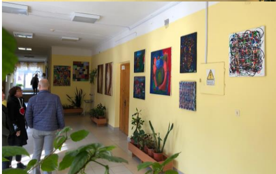
Hans Vronik galerij