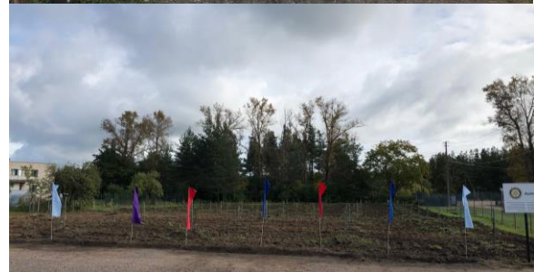
Krasnogorodsk Agro special school