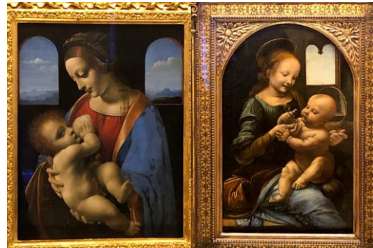
Schilderijen Leonardo da Vinci

Aangezien het voor de meerderheid van ons de eerste keer naar Rusland of St. Petersburg betrof, bevatte het programma ook de nodige "sight seeing". Zaterdag werd als eerste natuurlijk de Hermitage bezocht, met o.a. de beroemde schilderijen van Leonardo da Vinci, en daarna ook nog de Kathedraal.