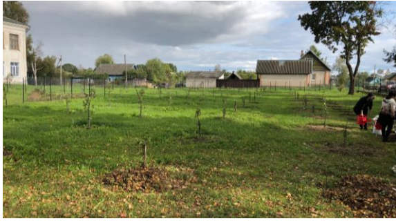
Opochna boarding school

Bij alle weeshuizen had de jonge aanplant de winter overleefd en de gaarden, inclusief omheiningen, lagen er mooi bij.