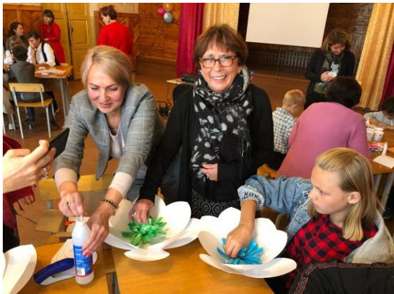
Gilla creatief met papier.

In Opochna werd er aansluitend nog creatief geknutseld met de weeskinderen en werden er mooie dingen gemaakt.