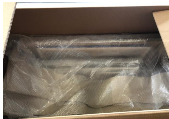
Transport 15 schilderijen

Zoals voorheen beschreven hadden de dames van het weeshuis een aantal schilderijen van Hans uitgezocht die ze in het weeshuis zouden tentoonstellen en zo en ging er een grote pallet met doos op transport naar Rusland en ontstond er de Hans Vronik Galerij.