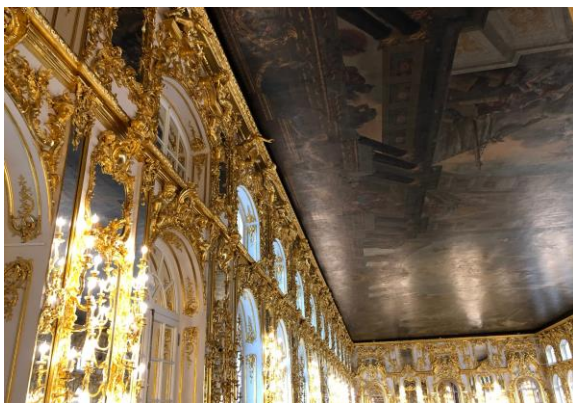
Paleis Catherina de Grote

Ondanks dat het paleis grotendeels was verwoest in de tweede wereld oorlog, is het weer prachtig gerestaureerd met veel pracht en praal.